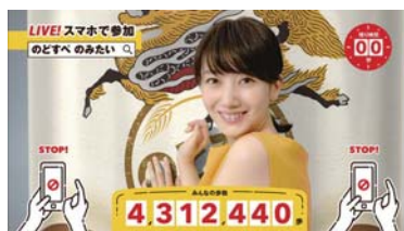
INTERACTIVE LIVE CM (麒麟ビール)