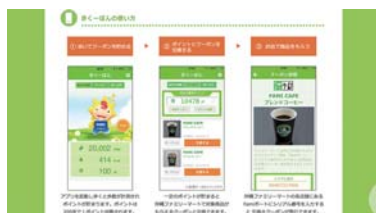
RBCおきなわ健康長寿プロジェクト 歩くーぽん (琉球放送)