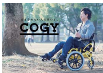
COGY/あきらめない人の車いす (TESS・東北大学・M2デザイン研究所・TBWA\HAKUHODO ギークピクチャーズ/博報堂プロダクツ/AID-DCC)