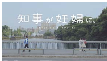
ワーク・ライフ・バランス推進キャンペーン (九州全県・山口県・沖縄県)