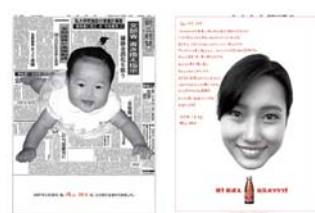
オロナミンC 『20年分のありがとう新聞』 (大塚製薬)