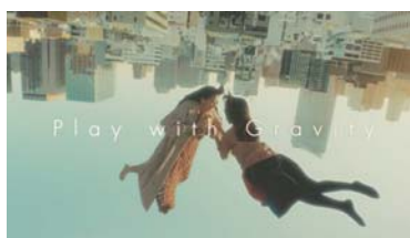
GRAVITY CAT (ソニー・インタラクティブエンタテインメント)