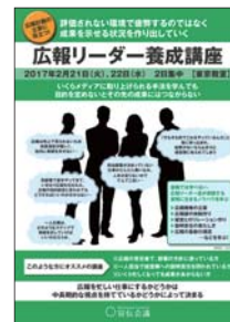
広報リーダー 養成講座