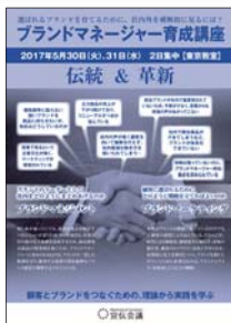
ブランドマネージャー 育成講座