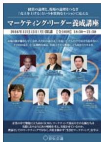
マーケティングリーダー 養成講座