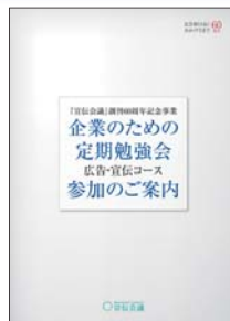
企業のための定期勉強会 宣伝コース