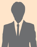
マーケティング部 Fさん