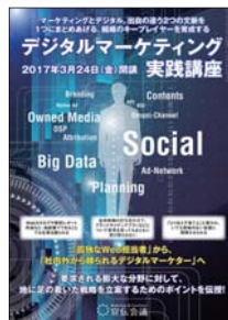
デジタルマーケティング 実践講座