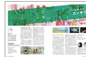
モンデリーズ・ジャパン

企業が課題テーマを出し、テーマに対するクリエイティブ作品を、複数のクリエイターが持ち回りで制作します。各クリエイターの感性を元に、新たなクリエイティブが生まれます。