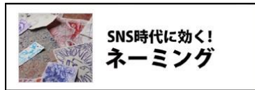
SNS時代に効く！ ネーミング