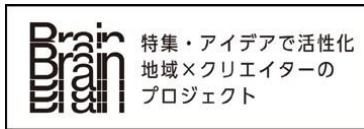
特集・アイデアで活性化 地域×クリエイターの プロジェクト