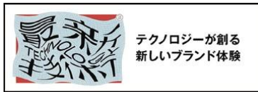
テクノロジーが創る 新しいブランド体験

最新のクリエイティブを徹底取材し、デザイン・広告の最先端と未来を予測する編集構成