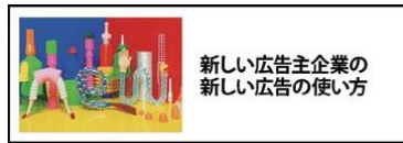
新しい広告主企業の 新しい広告の使い方