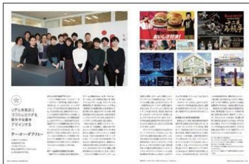
テー・オー・ダブリュー

編集部が貴社のサービスや事例を取材。お客様事例や商品・サービスのレポート、貴社のトップへのインタビューなど、読者に伝わるように魅力的にまとめます。誌面を抜き刷りとして印刷し、貴社の営業ツールとしても活用できます。(別途オプション)