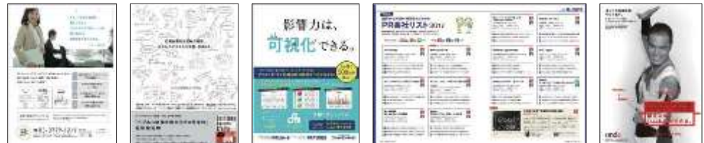
エレクトロニック ライブラリー

ターゲットに向けた認知・関心の向上、ブランディングに。 広告が読者にとっての重要な情報源になっています。