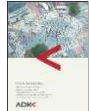
アサツー ディ・ケイ